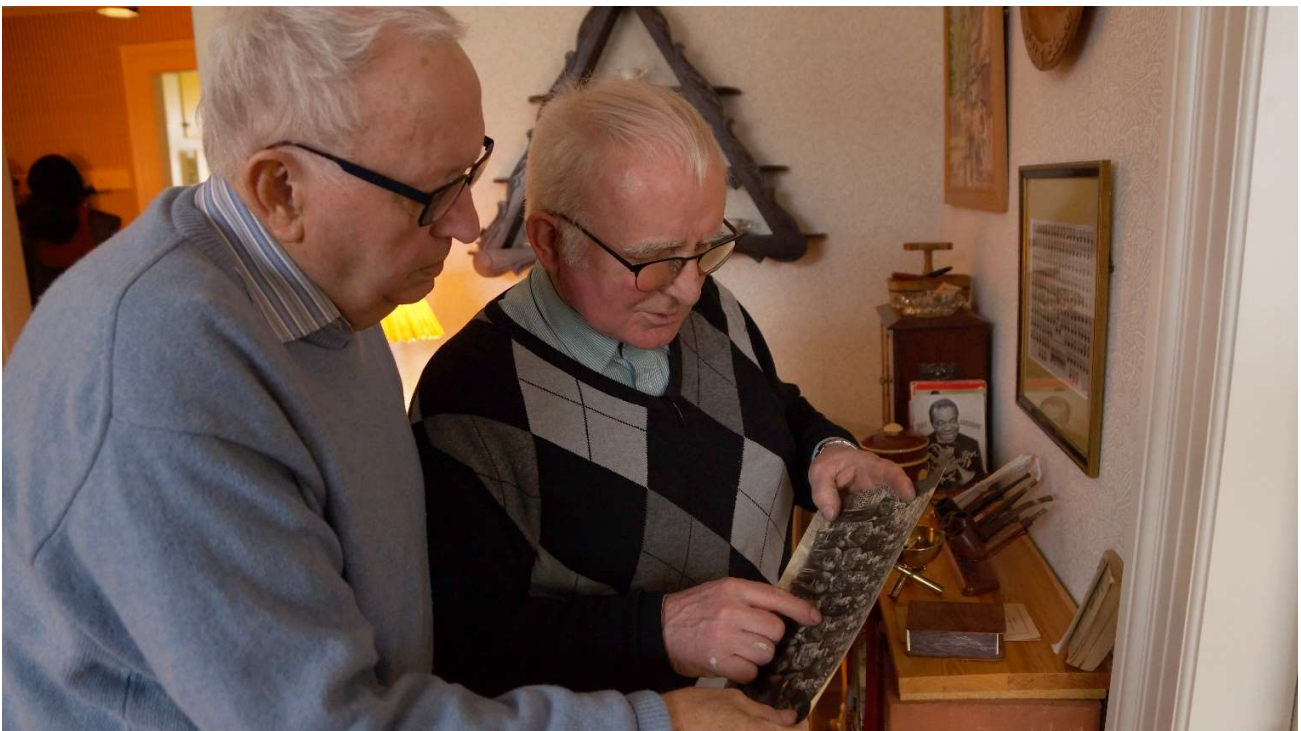
Forløb i Den Gamle Bys erindringslejlighed. Modelfoto.

God jul, godt nytår og glædelig fortællinger.